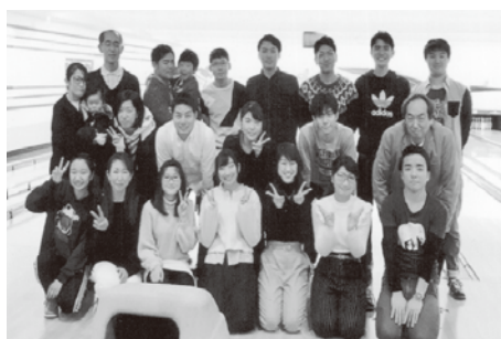
ボウリング場で記念写真

で短時間で終了しました。大人も子供も、実行委員の皆さんも、終始笑顔の絶えない、有意義で充実した初顔合わせとなりました。