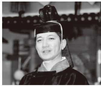
ご教話なさる祭主・本部長様

「事が大変重要なのです。日本には「言霊」という言葉も在ります様に、口に出した言葉が空気を震わせ、神様の御心を震わせるのです。」 と申しましても、玉串奉奠の際など、大声で口にする必要は在りません。自分だけが解る僅かな音量で結構ですので、はっきりと言葉にするということです。 その内容に関しましても、例えば、お商売されて居られる方なら、「今年も商売繁盛、沢山儲かります様に」といった、大まかなお願いでは神様に届きません。 そうでは無く、「今期は売り上げを何%伸ばしたい」と思っております」といった様に、具体的な内容まで神様にお聞き頂くことが重要なのです。 そして、一生懸命お願い