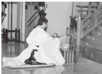
冬至祭、お蠟燭点火される祭主、本部長様

ご注意が出ており、思想にしましては、国内では変わりはないということですが、疫病ですが、国内で二月と七月にご注意が出ております。それぞれインフルエンザや夏の病気が流行る時期ですので、十分にお気を付け下さい。